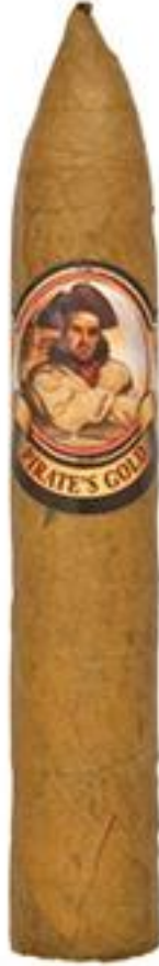
BELICOSO (5 x 52)