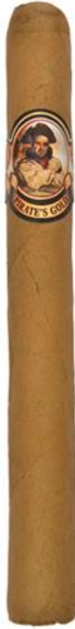
CHURCHILL (7 1/4 x 53)