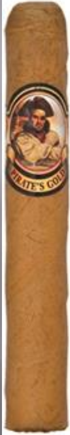
ROBUSTO (5 x 50)