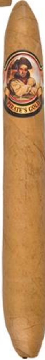
FIGURADO (7 x 58)