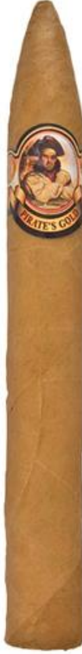
PIRAMIDE (7 1/2 x 64)