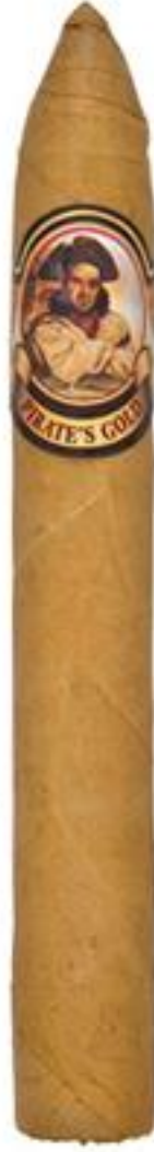
TORPEDO (6 1/8 x 52)