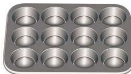
moule à muffins