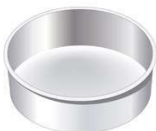
moule à gâteau