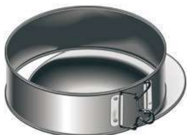
moule à fond amovible