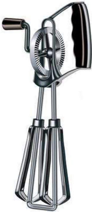
+ batteur à œufs