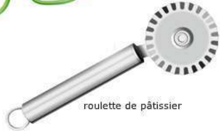
roulette de pâtissier