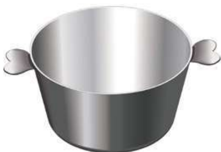
moule à charlotte