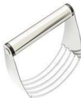
mélangeur à pâtisserie