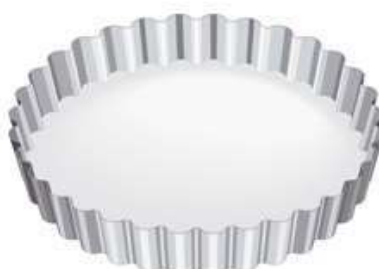
moule à quiche