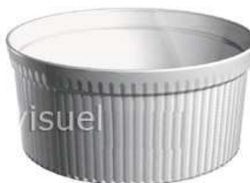
moule à soufflé