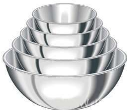
bols à mélanger+