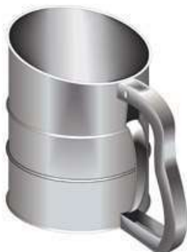
+ tamis à farine