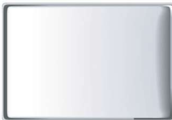
plaque à pâtisserie