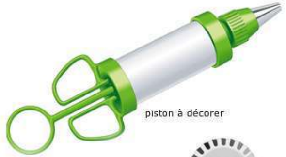
piston à décorer