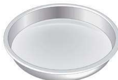
moule à tarte